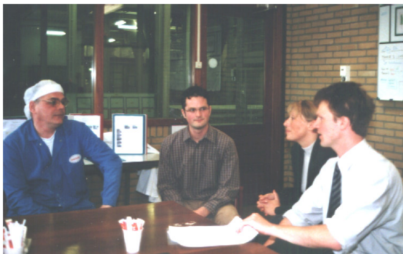
Beszélgetés a gépkezelőkkel

Az OEE Quickscan felmérés logikusan felépített választ ad arra, hogyan érdemes hozzákezdeni a gépek hatékonyságának növeléséhez.