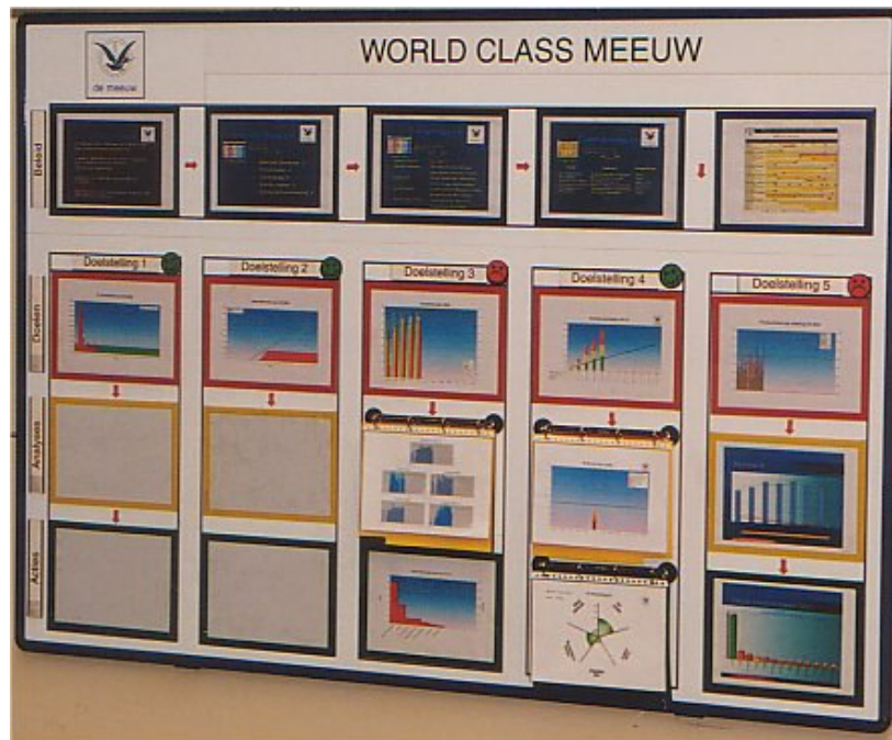
Policy Deployment: van doelstellingen naar concrete acties.