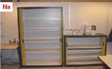
5S, stap 1: verwijder alles wat overbodig is.

Om u de verliezen, de niet-waarde toevoegende activiteiten, in een kantooromgeving te leren zien, heeft Blom Consultancy de ‘World Class Offices Workshop’ ontwikkeld.